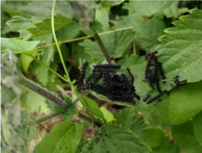
Sommerfuglelarverne er flyttet ind i brændenældebedet