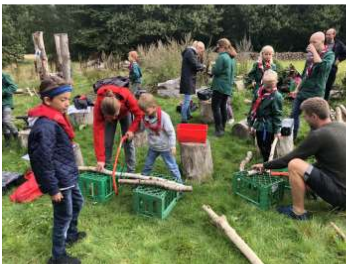
Spejderne bygger på insekthotellet

I løbet af 2019 har vi også haft en række skoleklasser og spejdergrupper på besøg. Og så har vi naturligvis afholdt en række møder både internt og med eksterne parter.