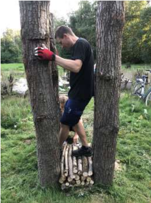
Et af insekthotellerne bygges op