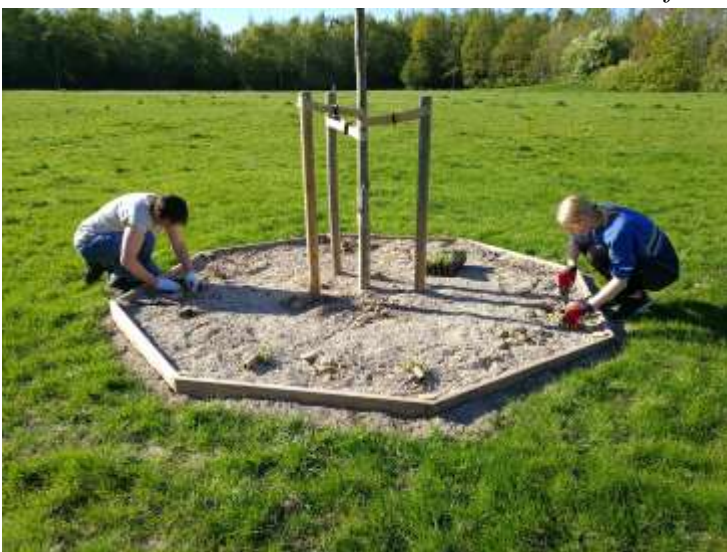
Plantning af urter omkring egetræerne