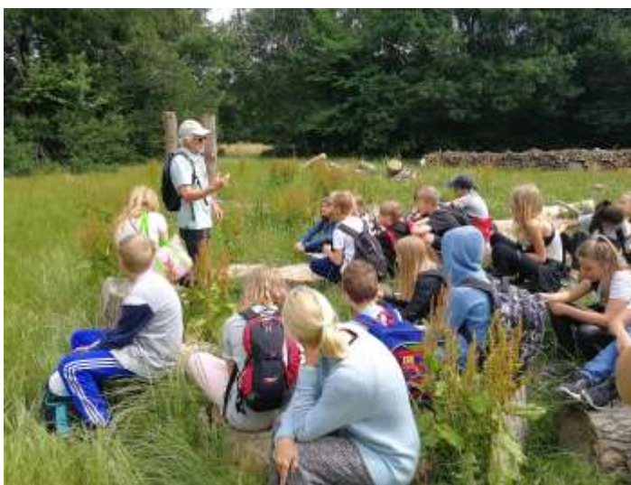
Undervisning i det fri