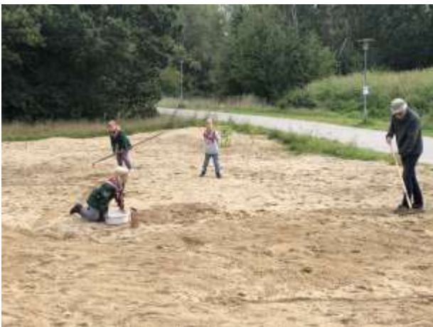
Spejderne hjælper med klargøring og tilsåning af det store grusbed