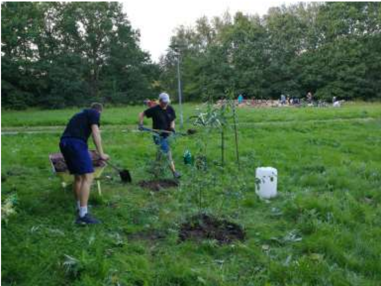
Plantning af tørst til citronsommerfuglen