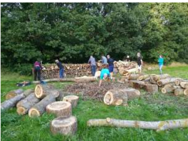
Brændemuren med jord mellem træet og urter på toppen bygges